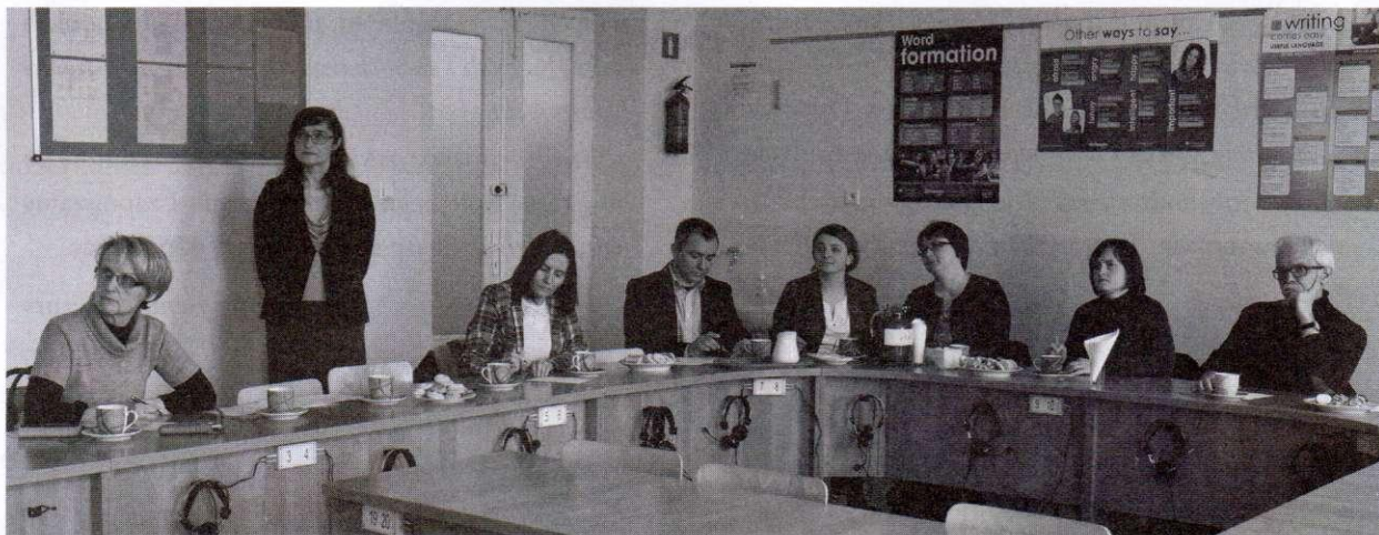
Nauczyciele – opiekunowie uczestników konkursu podczas warsztatów